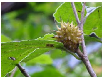
マンサクの虫こぶ