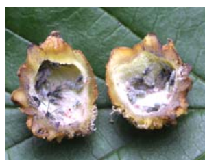
中にたくさんのアブラムシ