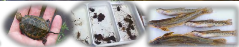
ニホンイシガメ幼体

荒川川では、これまで20種類前後の魚類、5種類のエビ・カニ類、トンボの幼虫など多数の水生昆虫や、ニホンイシガメなどの希少種も確認されています。近年、北米原産のコクチバスや北海道原産のフクドジョウが増加しており、生物相の変化が注目されます。