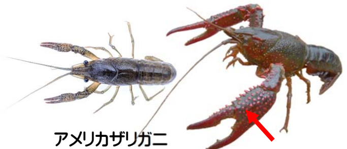
アメリカザリガニ

ウチダザリガニほど大きくならない。若い個体は緑黄褐色、成熟すると赤色になる。ハサミの表面にツブツブ、トゲトゲの突起がある。