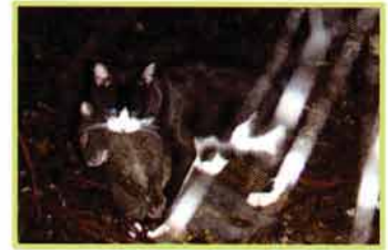
アマミノクロウサギを捕食するノネコ

ノネコは小型哺乳類や鳥類、爬虫類、両生類、昆虫類などさまざまな生き物を食べてしまいます。また、エサとして食べてしまうだけでなく、「遊び」としてのハンティングを行うことも。さらに、1頭のメスが生涯に50～150頭も出産可能なため、野外でどんどん増えて希少種に大きな被害を与えています。ノネコは世界や日本の侵略的外来種ワースト100に選ばれています。